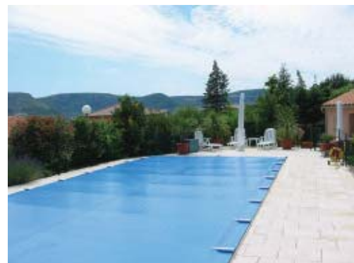
Couverture de sécurité SUPER SECURIT