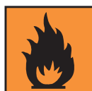
F - Inflammable

Ce symbole ne se trouve que sur les produits "oxydants" qui apportent un comburant : ils ne sont pas inflammables mais ils augmentent l'activité d'un feu.