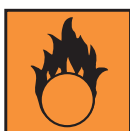
O - Comburant

Vous trouverez ce symbole "irritant" sur presque tous nos produits. En effet, il s'agit de produits très concentrés qui, à ce degré de concentration, sont irritants. Très dilués ensuite dans la piscine, ils perdent tout caractère irritant.