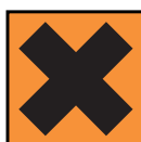
Xi - Irritant

En plus des phrases de Risques (R) et de Sécurité (S) qui vous renseignent, les précautions à prendre et la conduite à tenir sur nos produits comportent principalement 6 symboles :